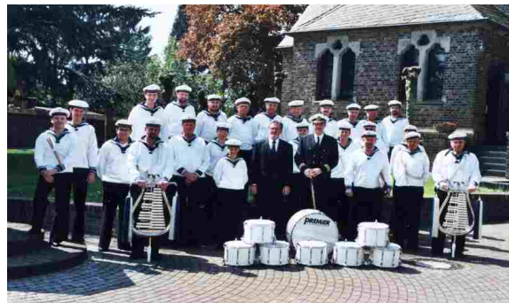
Das Corps im Jubiläumsjahr 1999

Während des 100-jährigen Bestehens hat das Tambourkorps Vynen zu zahlreichen Anlässen gespielt. D Festzuhalten bleibt, dass das Corps auch über die Dorfgrenzen hinaus als musikalischer Botschafter bis