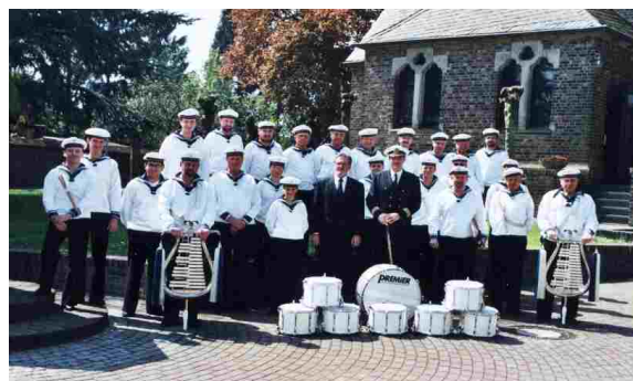
Das Corps im Jubiläumsjahr 1999

Während des 100-jährigen Bestehens hat das Tambourcorps Vynen zu zahlreichen Anlässen gespielt. D Festzuhalten bleibt, dass das Corps auch über die Dorfgrenzen hinaus als musikalischer Botschafter bis